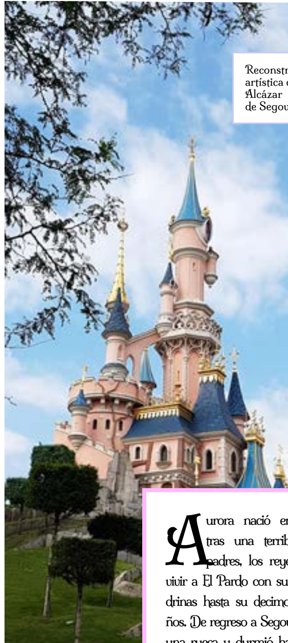
Reconstrucción artística del Alcázar de Segovia.

Érase una vez una princesa, llamada Aurora, que permaneció cautiva en un sueño durante siglos. Con el paso de los años, la historia de la bellísima princesa de largo cabello dorado y piel de melocotón, se convirtió en leyenda y navegó por las olas del tiempo, susurrada de madres a hijas como la fábula de la Bella Durmiente.